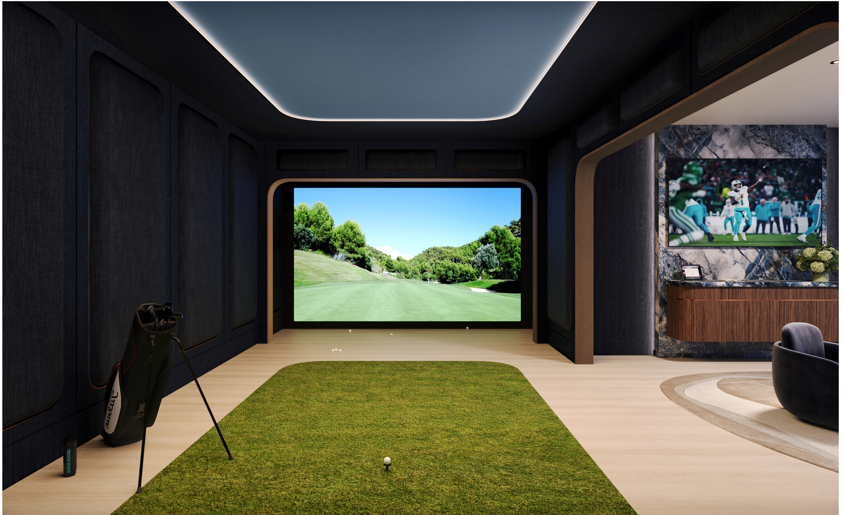
Simulador de golf