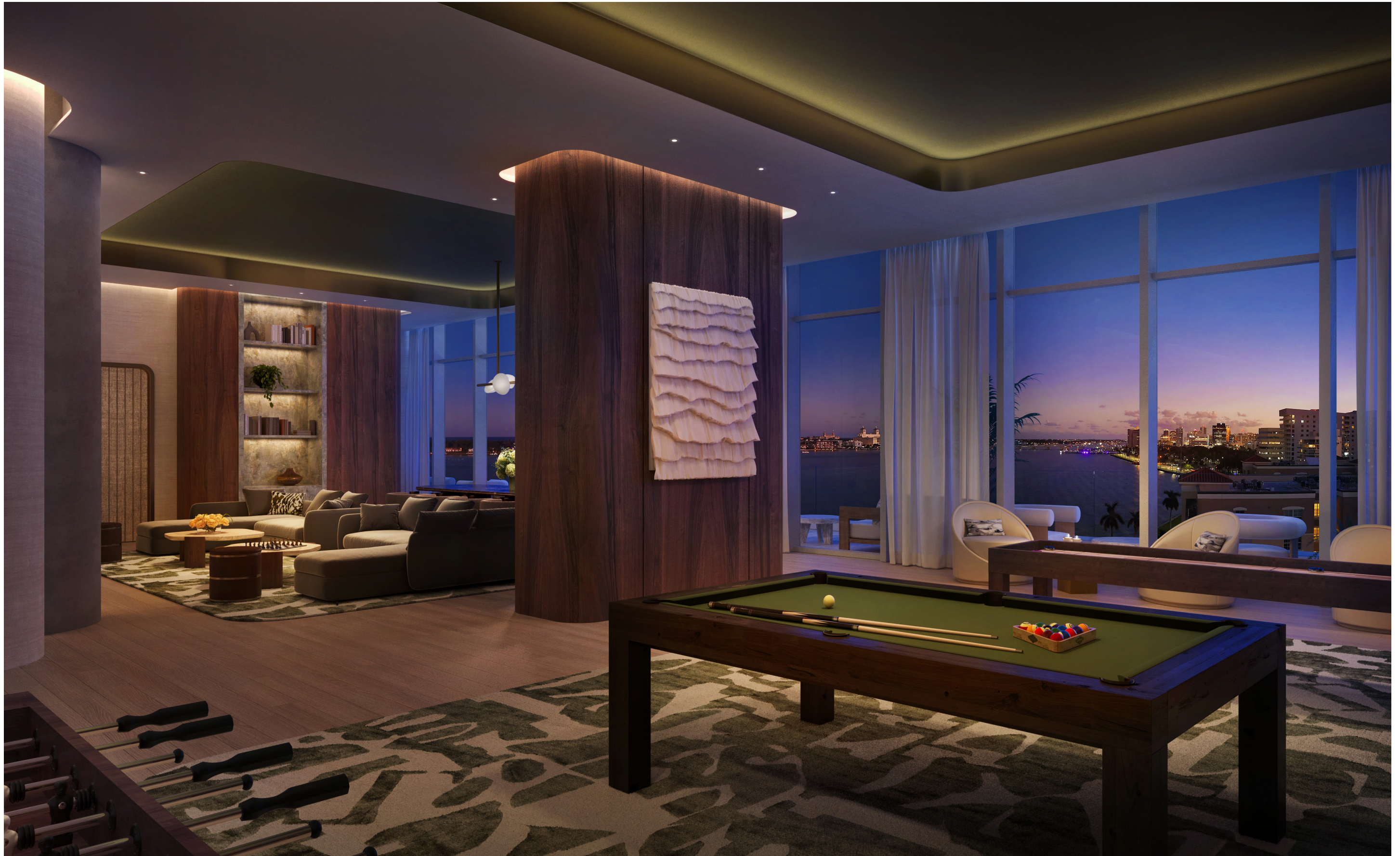
Sala de juegos