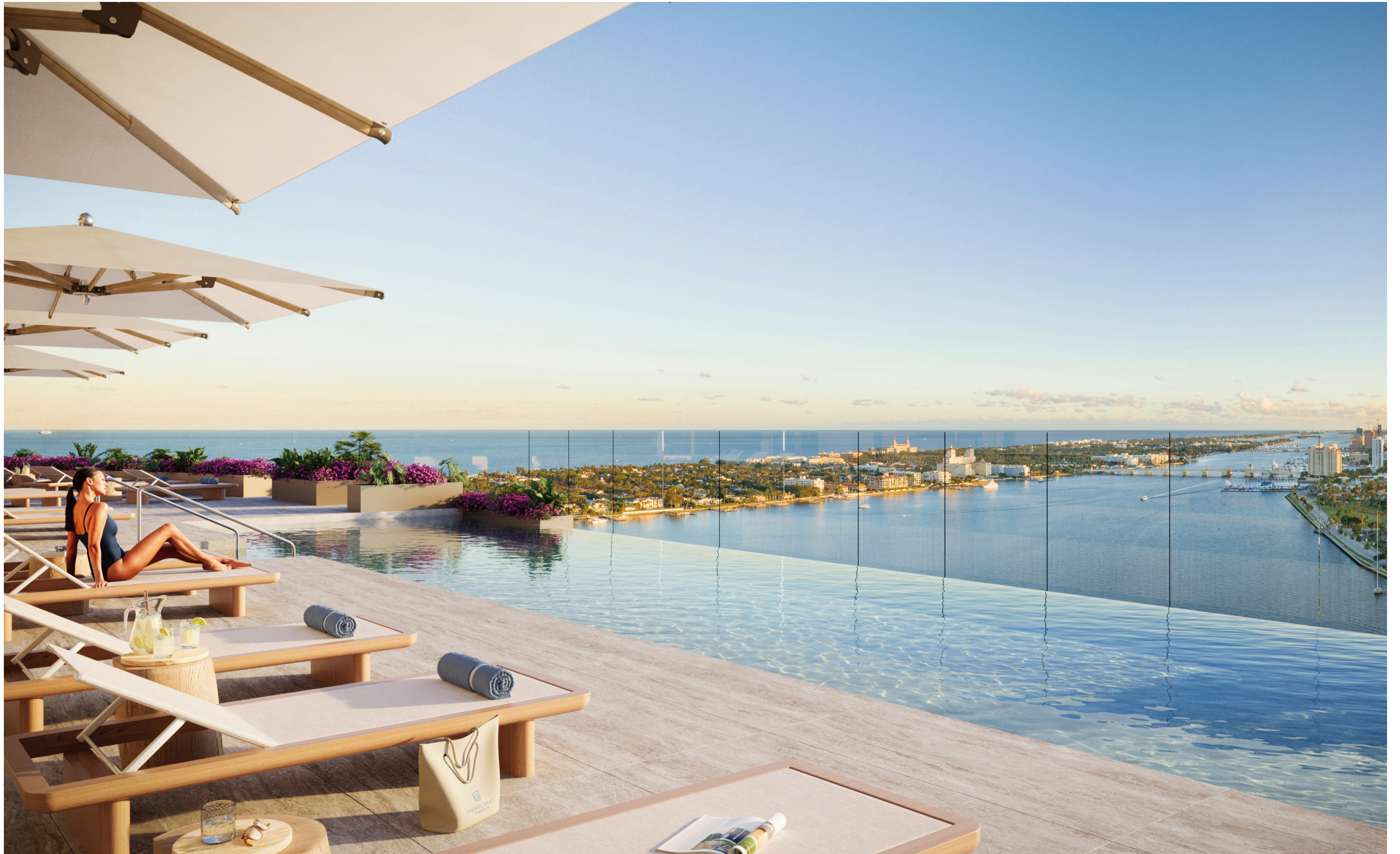
Piscina en la azotea